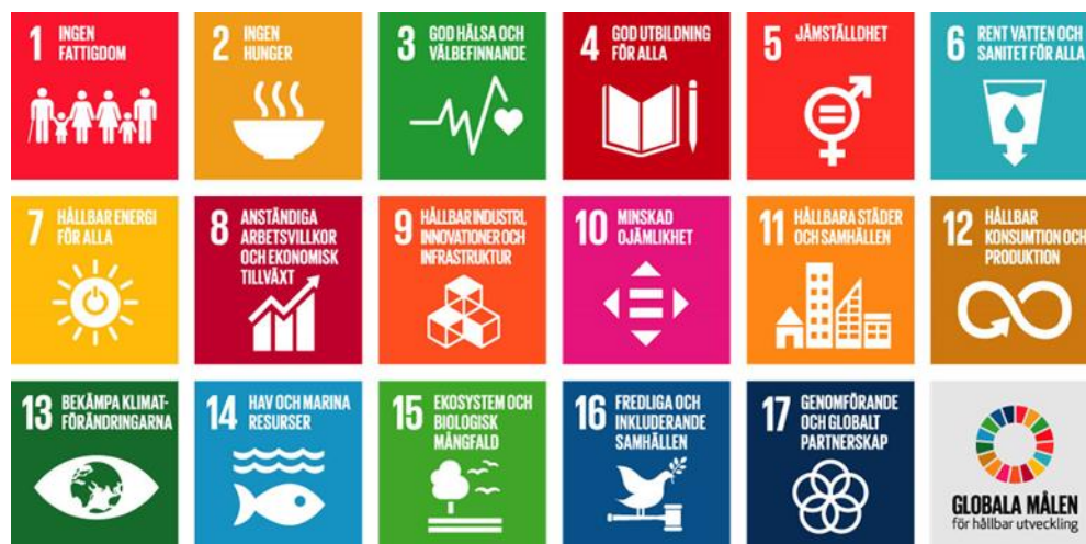
Figur 1: De 17 globala målen (Agenda 2030)

En hållbar utveckling kan beskrivas som en utveckling som tillfredsställer dagens behov utan att äventyra kommande generationers möjligheter att tillfredsställa sina behov. Hållbarhetsstrategin förenar Bollnäs kommuns program för social hållbarhet, Bollnäs kommuns program för ekologisk hållbarhet och Bollnäs kommuns kommande program för ekonomisk hållbarhet.