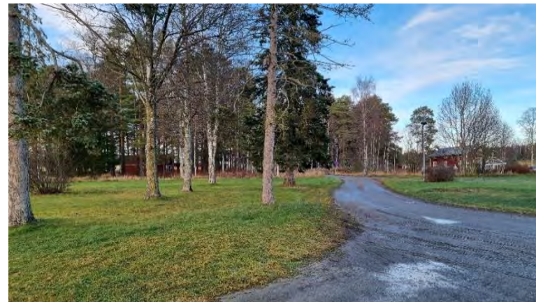
Ovan vänster: Slottet till vänster och det gamla fattighuset till höger. Ovan höger: Det gamla sanatoriet bakom dagens sportanläggning. Nedan vänster: Det gamla fattighuset från norr. Nedan höger: Parken norr om slottet.